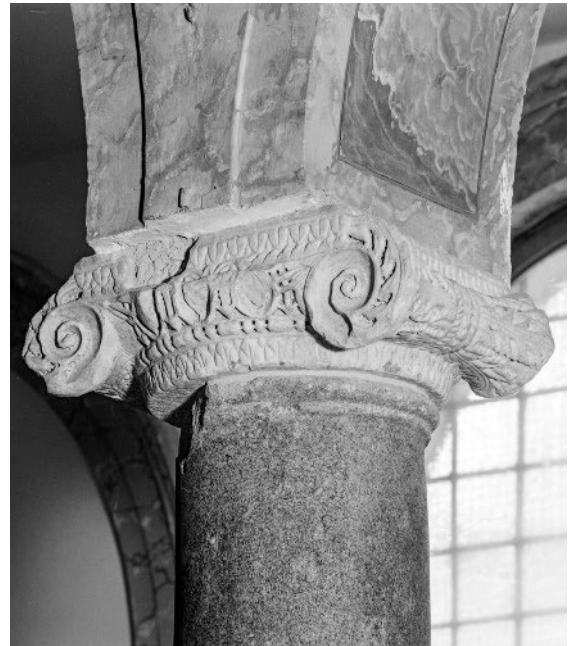
Abb. 269: Rom, S. Maria in Monterone, Konstantinisches Kapitell der 3. Säule auf der linken Seite (vom Eingang aus gesehen)

Stuckgewölbe durch eine Kassettendecke ersetzt. 1893 restaurierte man das Paviment. Die Kirche ist in der alten wie der neuen Guidenliteratur wenig beachtet worden und hat so gut wie kein kunsthistorisches Interesse auf sich gezogen. 10