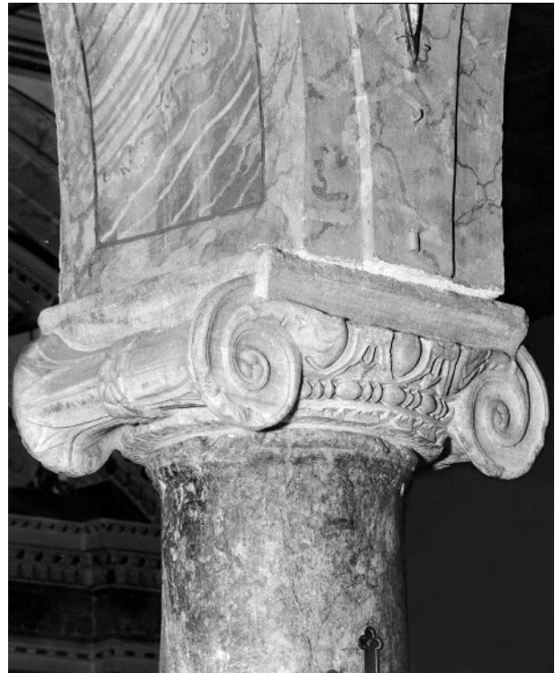
Abb. 271: Rom, S. Maria in Monterone, Kapitell der dritten Säule auf der rechten Seite (PM-Laz)

Arkadenhöhe von annähernd sieben Metern. 19 Das im 17. Jahrhundert überlieferte Höhenmaß von 11 m mag der mittelalterlichen Höhe entsprochen haben. Damit wäre ein mit Arkaden ausgestattetes Untergeschoss auffällig überproportioniert. Die Schlussfolgerung aus diesen Erwägungen betrifft den ursprünglichen Bautypus: Hohe Säulen mit durchweg ionischen Kapitellen sind im 12. Jahrhundert charakteristisch für Basiliken mit architravierter Langhauskolonnade wie in S. Crisogono oder S. Maria in Trastevere. 20 Spolienkapitelle kamen in Rom in der zweiten Hälfte des 12. Jahrhunderts außer Gebrauch, 21 sind aber kennzeichnend für römische Basiliken seit frühchristlicher Zeit mit einem Höhepunkt in der ersten Hälfte des 12. Jahrhunderts. Säulen und Kapitelle der Basilika liefern Indizien dafür, dass die hochmittelalterliche Kirche vermutlich eine Kolonnadenbasilika mit Architrav war und im dritten oder vierten Jahrzehnt des 12. Jahrhunderts entstanden ist. Diese Basilika, die schon in ihrer Bauzeit mit einem Cosmatenboden ausgestattet wurde, bekam vermutlich nach 1240 ein Altarziborium. Ob in dieser Zeit die gesamte liturgische Ausstattung erneuert wurde, ist ungewiss. Die von Panciroli (1600) erwähnten einstigen Wandmalereien sind keinem der hier erwogenen oder dokumentierten Daten – 1140, 1241/45 oder 1351 – sicher zuzuordnen.