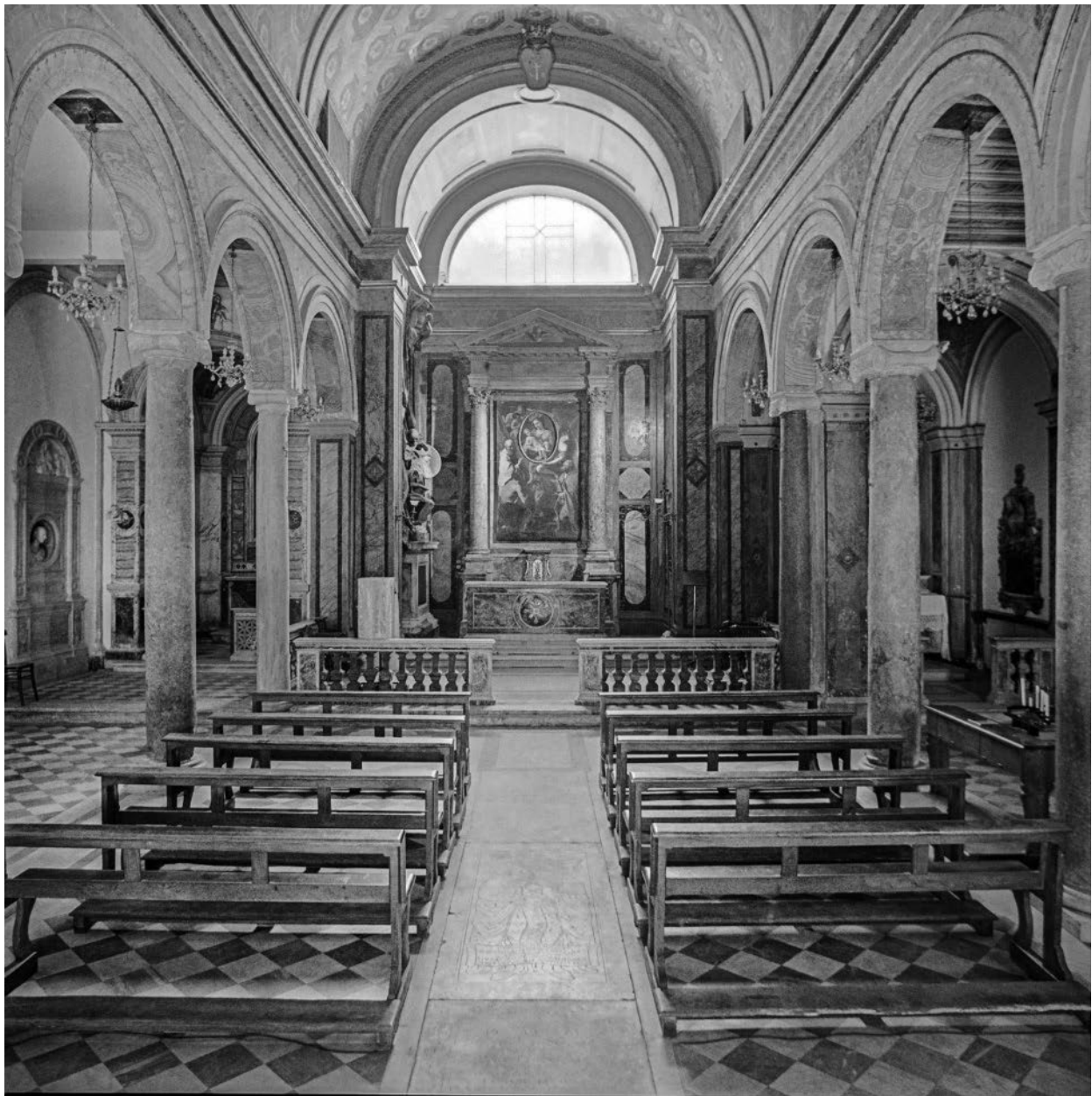
Abb. 267: Rom, S. Maria in Monterone, Innenraum mit Blick zum Altar (PM-Laz)

Portalsturz hat sich eine Weihinschrift von 1542 erhalten. Neuzeitliche Erneuerungen sind 1597 (unter Pfarrer Giacomo Crillo Bolognese) und vor allem unter Innocenz XI. (1676–1689) erfolgt. Die Fassade wurde 1682 (Inscription der Kartusche im Giebel) errichtet. Mehrfach erhöhte man das Paviment, zuletzt 1754. 7 1723 gab Benedikt XIII. (1724–1730) die Kirche der Confraternita di Maria Santissima della Mercede del riscatto degli Schiavi, welche Chor und Sakristei der Kirche restaurieren ließ. Pius VII. (1800–1823) überließ sie den Padri della Congregazione del Redentore, die weitere Restaurierungen in Angriff nahmen. Im Zuge dieser Maßnahmen wurde der Hochaltar 1817 neu geweiht. 8 Die Pfarrrechte ließ Leo XII. (1823–1829) nach S. Eustachio übertragen. 9 1848 wurden die barocken