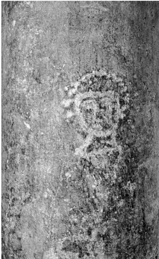
Abb. 270: Rom, S. Maria in Monterone, Gesicht am dritten Säulenschaft der rechten Seite (PM-Laz)